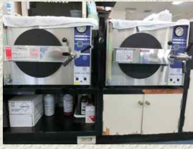
2機のオートクレーブ（高圧蒸気滅菌機）