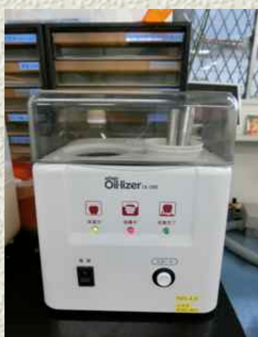
口腔内で使用するタービンやエンジンの滅菌に使うオイルライザー