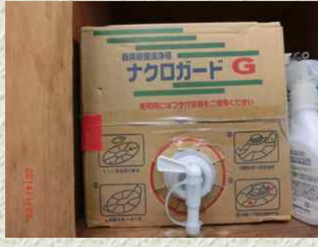
化学的消毒薬（ナクロガード）