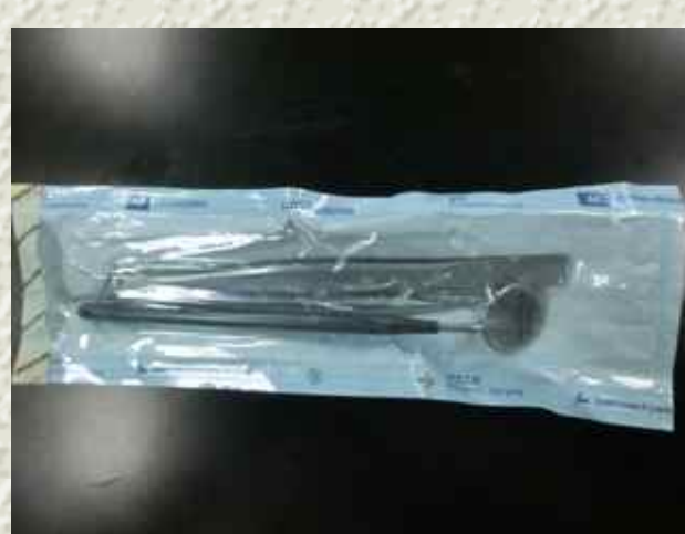
滅菌バッグに入った治療用具