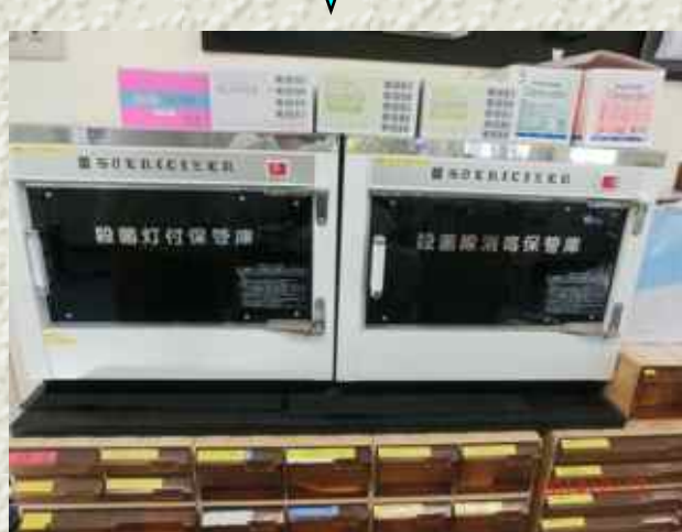
3機の紫外線殺菌保管庫（1機は別所）